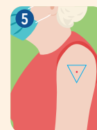
Vía de administración correcta